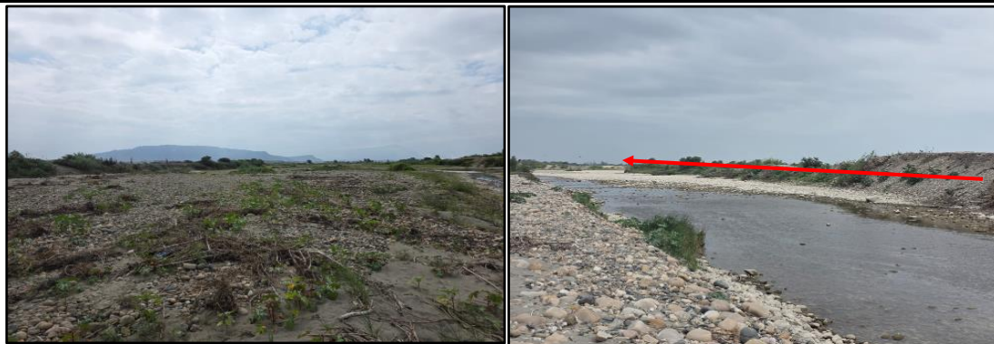
Limpeza y descolmatación del cauce del río Jequetepeque en el tramo